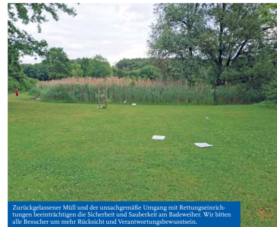
Zurückgelassener Müll und der unsachgemäße Umgang mit Rettungseinrichtungen beeinträchtigen die Sicherheit und Sauberkeit am Badeweiher. Wir bitten alle Besucher um mehr Rücksicht und Verantwortungsbewusstsein.