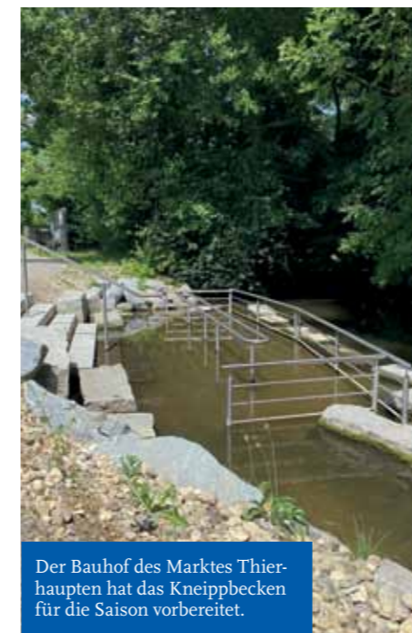
Der Bauhof des Marktes Thierhaupten hat das Kneippbecken für die Saison vorbereitet.

Wir möchten Sie darauf hinweisen, dass es sehr unangenehm für die Nutzer des Kneippbeckens ist, wenn spitze Steine hineingeworfen werden. Besonders Kinder sollten darauf achten, keine spitzen oder scharfkantigen Steine ins Becken zu werfen, da diese die Sicherheit der anderen Nutzer gefährden können. Der Bauhof des Marktes Thierhaupten hat das Kneippbecken bereits für die Kneipp-saison hergerichtet. Vor Ort stehen dort Rechen und Besen zur Verfügung, mit denen der Kies verteilt und das Becken sauber gehalten werden