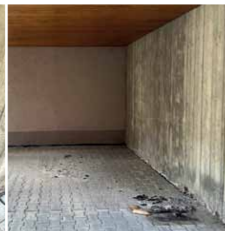
Sachbeschädigungen und Zündeleyen auf dem Schulgelände sind kein Kavaliersdelikt: Sie gefährden die Sicherheit von Kindern und verursachen erhebliche Kosten für die Allgemeinheit.