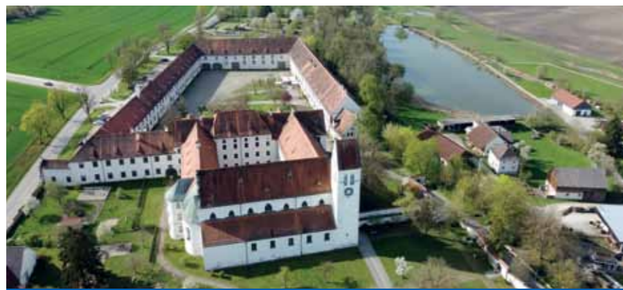
Der Fischerverein Thierhaupten lädt am 2. August 2026 zum traditionellen Königsfischen mit anschließendem Mittagessen am Klosterweiher ein.