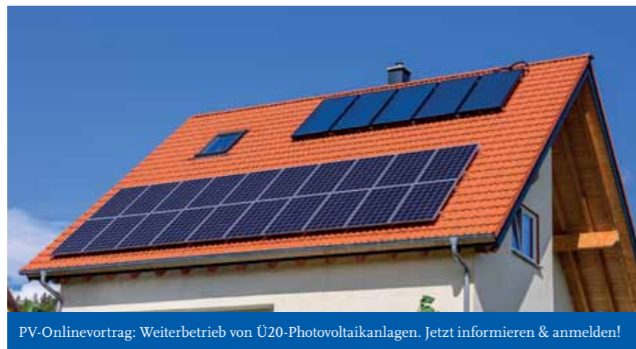
PV-Onlinevortrag: Weiterbetrieb von Ü20-Photovoltaikanlagen. Jetzt informieren & anmelden!