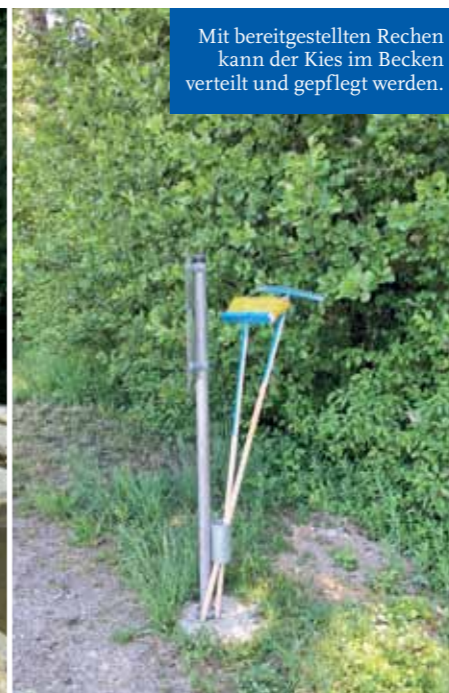
Mit bereitgestellten Rechen kann der Kies im Becken verteilt und gepflegt werden.

Möglicherweise führt eine solche Verstopfung auch zu Überflutungen, die an der Grundstücksgrenze nicht Halt machen und in privaten Grundstücken Schäden verursachen. Auch Unkraut führt dazu, Schmutz zurückzuhalten und verursacht abhängig davon Straßenschäden. Wir möchten in diesem Zusammenhang alle Straßenanlieger daran erinnern, die notwendigen Reinigungs- und Unterhaltungsarbeiten im eigenen Interesse wahrzunehmen.