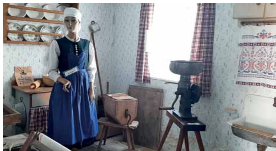
Die Heimat- und Trachtenstube ist geöffnet am Sonntag, den 12.07.2026 von 14 bis 16 Uhr oder nach Vereinbarung. Wir freuen uns auf Ihren Besuch!