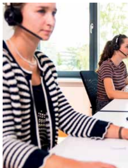
Soforthilfe in belastenden Situationen: Der Krisendienst ist rund um die Uhr für Sie da.