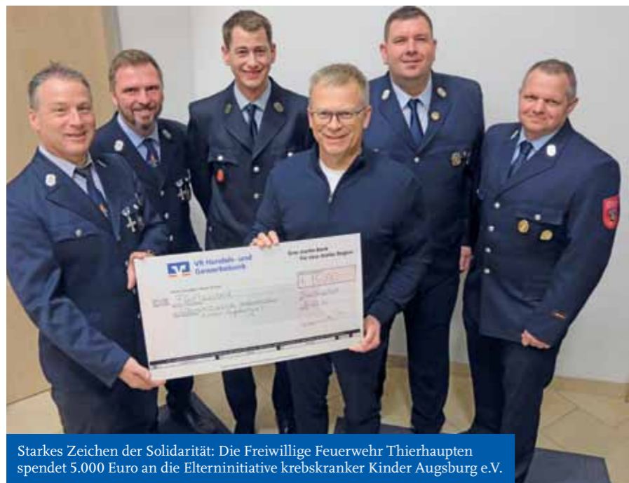
Starkes Zeichen der Solidarität: Die Freiwillige Feuerwehr Thierhaupten spendet 5.000 Euro an die Elterninitiative krebskranker Kinder Augsburg e.V.

Wer Interesse an unserem Kinderchor hat, kann sich gerne bei unserem Vorstand per E-Mail melden (dm.harmonie.th@web.de).