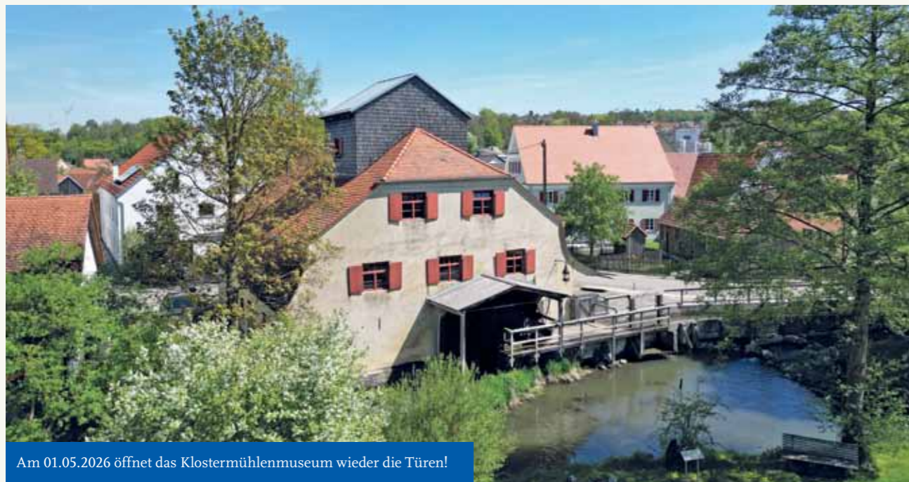
Am 01.05.2026 öffnet das Klostermühlenmuseum wieder die Türen!

Ab sofort ist das Museum für Sie Freitag und Sonntag sowie feiertags von 14:00 bis 17:00 Uhr geöffnet. Führungen sind außerhalb der Öffnungszeiten nach Anmeldung gerne möglich. Klostermühlenmuseum Franzengasse 21 86672 Thierhaupten info@klostermuehlenmuseum.de www.klostermuehlenmuseum.de