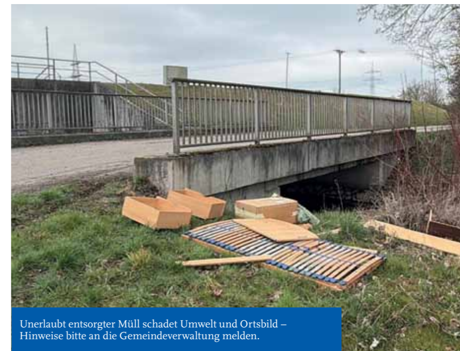
Unerlaubt entsorgter Müll schadet Umwelt und Ortsbild – Hinweise bitte an die Gemeindeverwaltung melden.

IHRE MARKTGEMEINDE THIERHAUPTEN IST FÜR SIE DA!