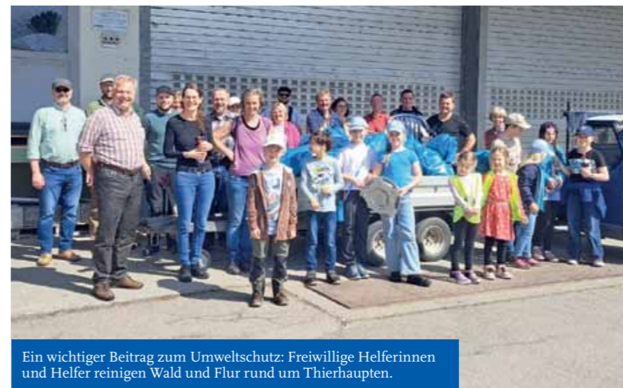
Ein wichtiger Beitrag zum Umweltschutz: Freiwillige Helferinnen und Helfer reinigen Wald und Flur rund um Thierhaupten.

Der Markt Thierhaupten möchte Sie darauf aufmerksam machen, dass grundsätzlich das Autowaschen auf dem Privatgrundstück erlaubt ist, allerdings nur mit klarem Wasser. Bitte achten Sie grundsätzlich darauf, dass keine gefährlichen Stoffe in das Erdreich gelangen. Auf öffentlichen Flächen ist das Autowaschen nach der Straßenverkehrsordnung verboten.