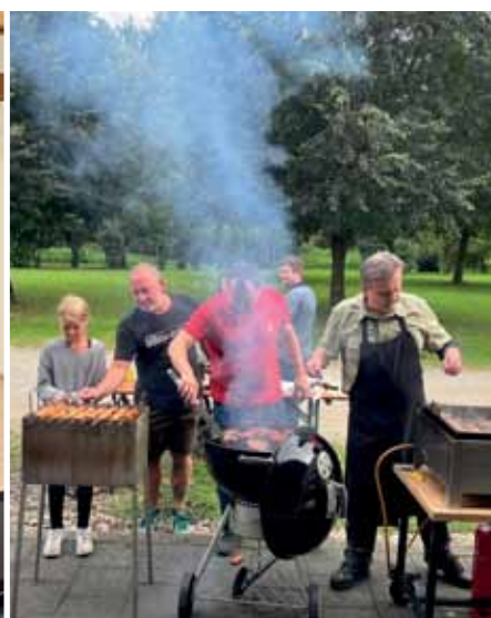
Beim Aktivenessen kamen Mitglieder und Unterstützer des Schützenvereins in geselliger Runde zusammen.