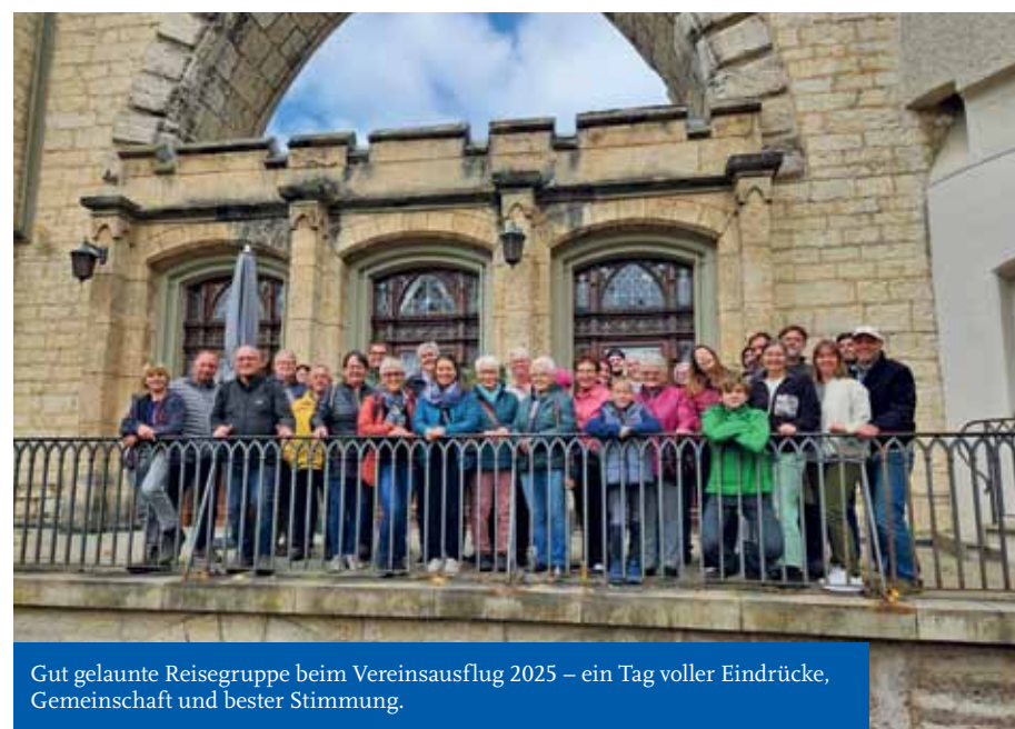
Gut gelaunte Reisegruppe beim Vereinsausflug 2025 – ein Tag voller Eindrücke, Gemeinschaft und bester Stimmung.