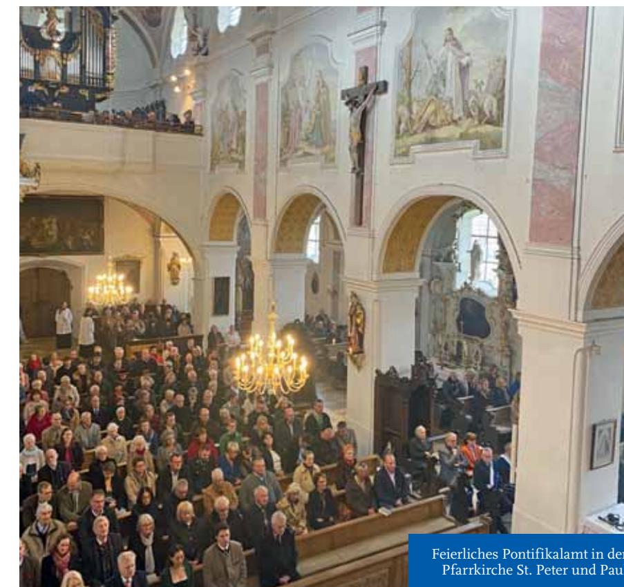
Feierliches Pontifikalamt in der Pfarrkirche St. Peter und Paul

450 Mal aufgerufen, was uns sehr freut. Diese Jubiläumsfeier wird uns noch lange in guter Erinnerung bleiben – als Zeichen der Wertschätzung für unser kulturelles Erbe und das lebendige Miteinander in unserer Gemeinde.