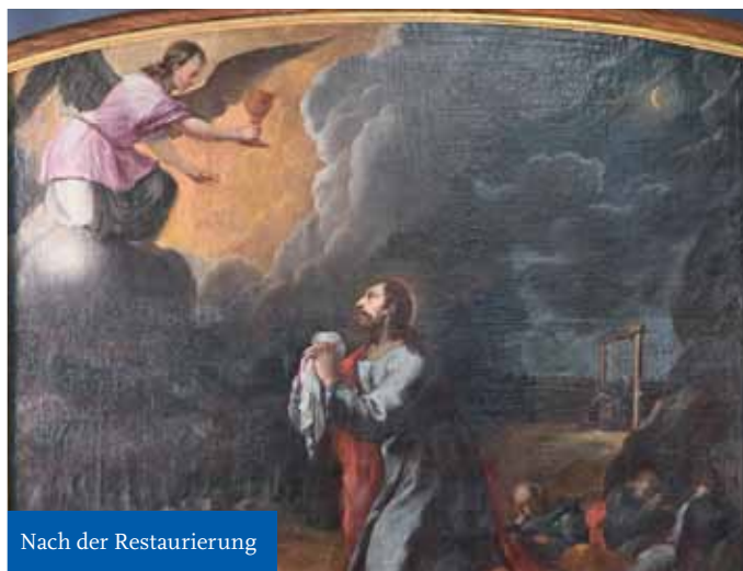
Nach der Restaurierung