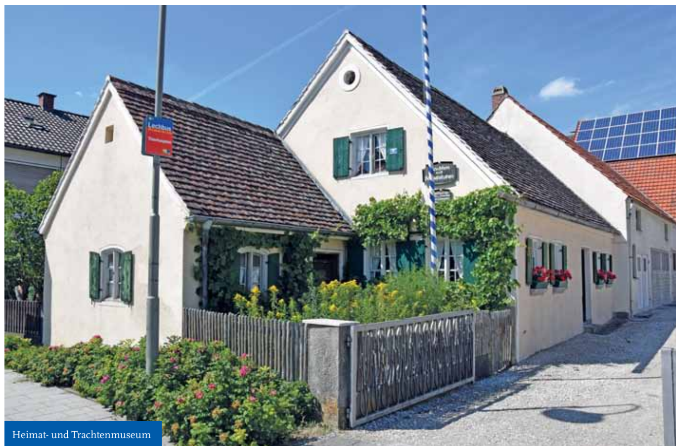
Heimat- und Trachtenmuseum

Info & Kontakt: www.facebook.com/JamSessionThierhaupten