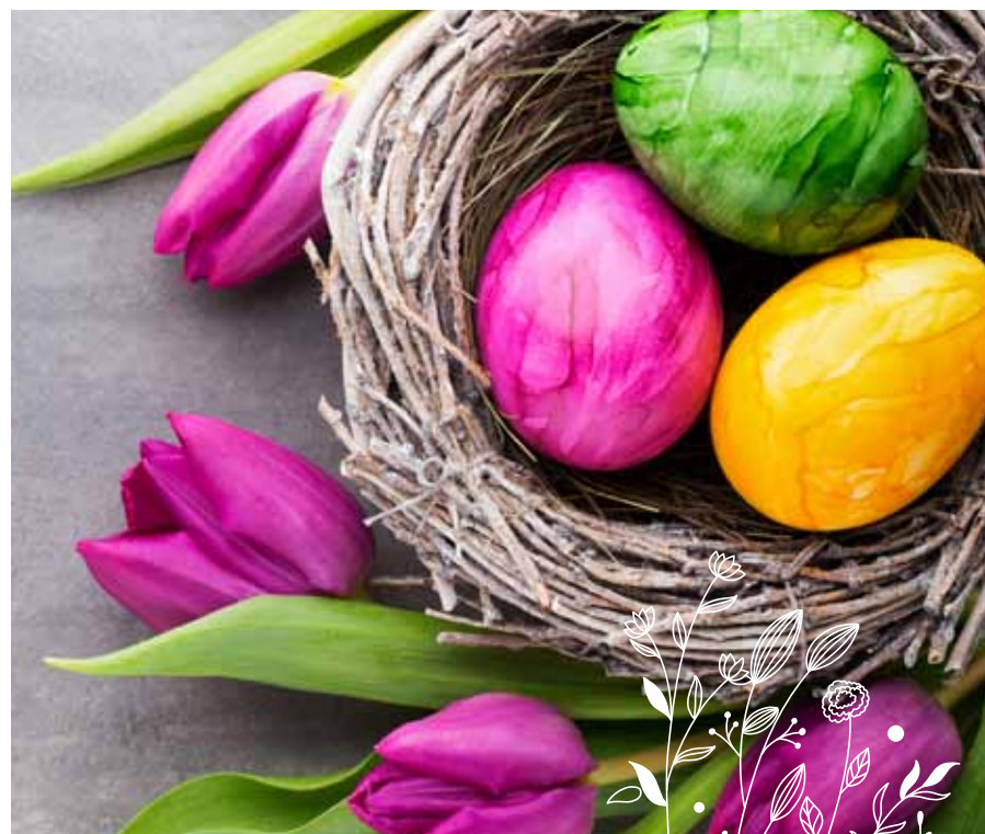
Frohe Ostern wünscht Ihnen Ihr Markt Thierhaupten